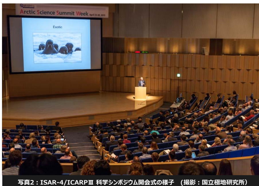
写真2：ISAR-4/ICARPⅢ 科学シンポジウム開会式の様子