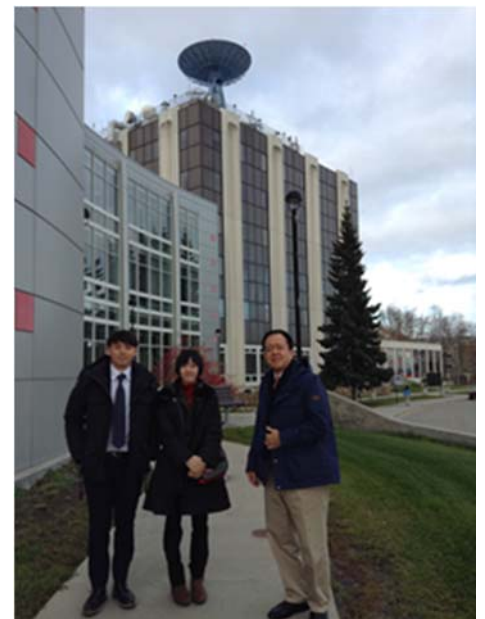
写真5：シンポジウム会場となったアラスカ大学フェアバンクス校にて、共同報告の院生と一緒に

2016年第9回シンポジウムは、Arctic Circleの直前にアイスランド・アクレイリ大学で開催されることが決定している。