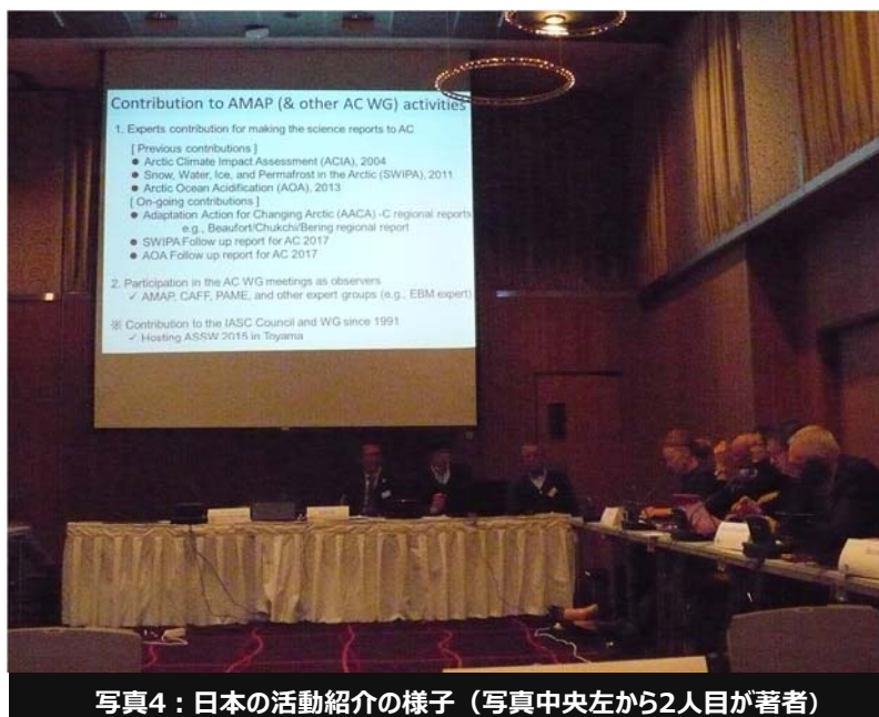
写真4：日本の活動紹介の様子（写真中央左から2人目が著者）

WG活動開始後19年目で初めての合同会議であった。今後に向けてのWGを越えての意見交換が目指され、気候変動、生物多様性、地域特性の変化、データマネジメント、という4つのテーマについての議論が行われた。